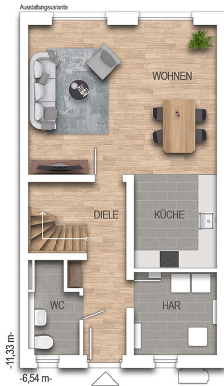
Reihenhaus F455 Grundriss EG